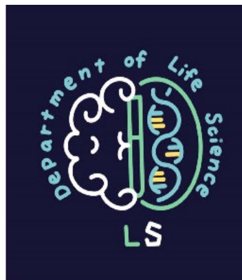
暗色底之配色概念